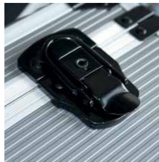
FIRIN BOYALI METAL KİLİT